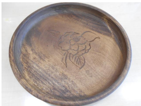
(※写真はイメージです。)